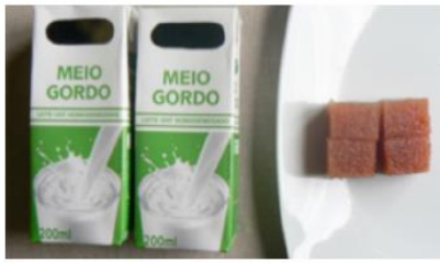
Leite simples (400ml) + 50 g de marmelada