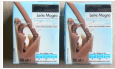
Leite achocolatado (400ml)