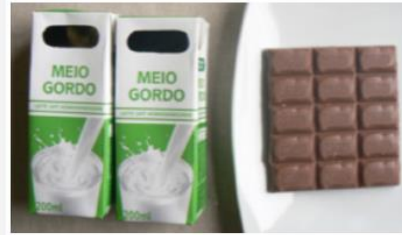
Leite simples (400ml) + 60 g de chocolate de leite