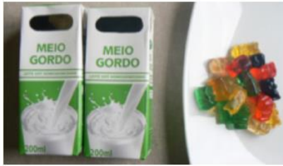
Leite simples (400ml) + 45 g de gomas