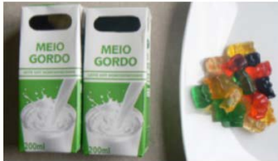
Leite simples (400ml) + 45 g de gomas