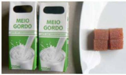
Leite simples (400ml) + 50 g de marmelada