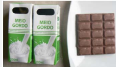
Leite simples (400ml) + 60 g de chocolate de leite