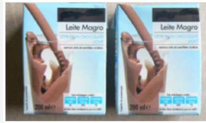
Leite achocolatado (400ml)